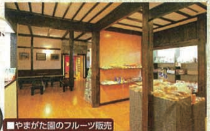
■やまがた圖のフルーツ販売